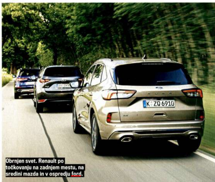
Obrnjen svet. Renault po točkovanju na zadnjem mestu, na sredini mazda in v ospredju ford.